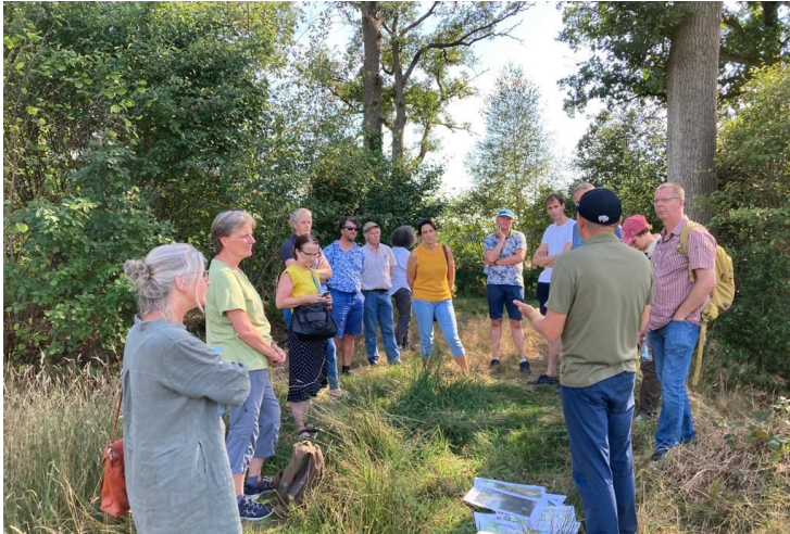
Bezoek aan Groot Zandbrink

Op 25 augustus jl. was het platform, op uitnodiging van Collectief Utrecht Oost, bijeen op Hoeve Groot Zandbrink. Er is onder andere gesproken over de bestemming van KLE in de omgevingsplannen van gemeenten; dit in relatie tot vergunningverlening en afwaardering. Er is informatie gedeeld over het budget voor beheer KLE in de periode 2023-2028.